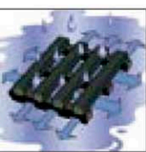
Das Wasser kann in vier Richtungen ablaufen.